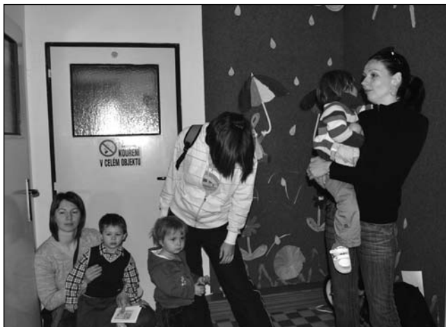
Zápis do MŠ