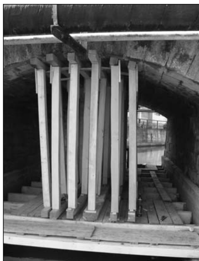
Oprava mostu přes Vlkavu

S nadcházejícím jarem se rozbíhá řada nových akcí, které byly schváleny v rozpočtu obce pro letošní rok. Jednou z těchto akcí je dokončení rekonstrukce komunikací v Rozkoši, V Glančici, v ulici Průběžná a chodníku K Nádraží. V Rozkoši je komunikace prakticky hotová a je připravena k předání.