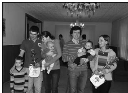
... a Viktorku a Ondru...