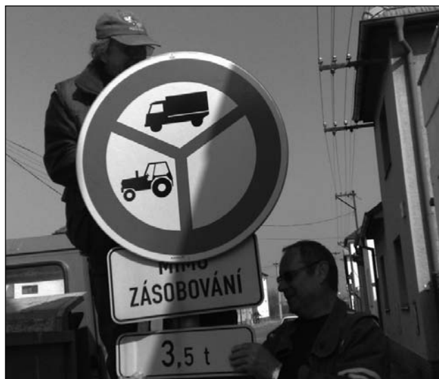
Výměna dopravního značení

Bližší informace o společnosti Eko-kom naleznete na www.ekokom.cz