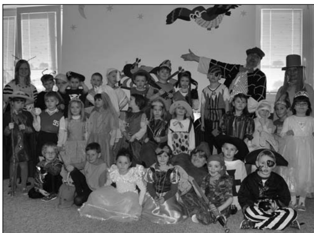
Maškarní karneval v balónkové třídě