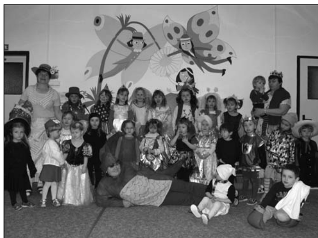
Maškarní karneval v kytičkové třídě